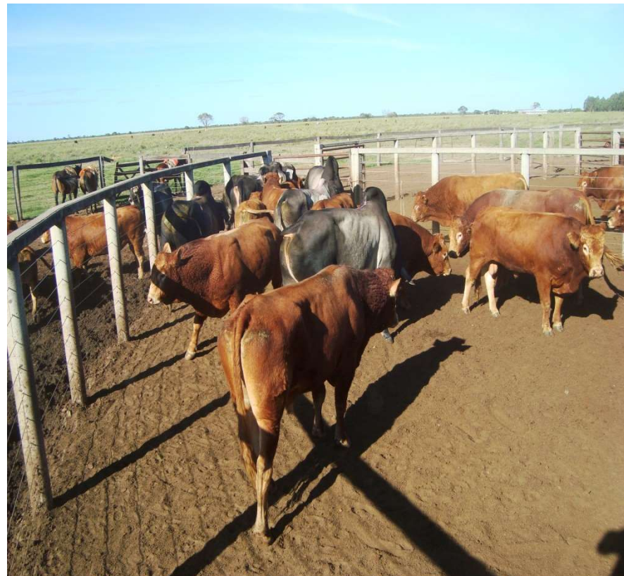
Figura 3 - Touros de repasse da raça Guzerá