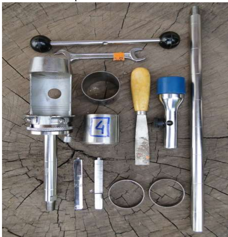
Figura 1 - Anel volumétrico e trado de amostra indeformada utilizados para coleta dos dados de atributos físicos